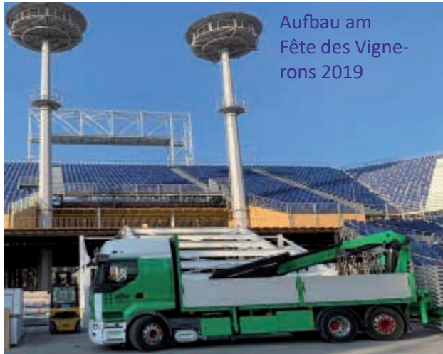
Müller Metallbau AG - Hauptstrasse 13 - 8259 Kaltenbach - TEL. 052 742 06 66 - www.mueller-metallbau.ch

Metall schafft Fundamente, Elemente und Strukturen; Grundlagen, auf denen Sie bauen können: Hallen, Häuser, Fassaden, Wintergärten, Türen, Tore, Treppen und vieles mehr.