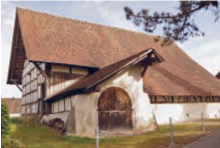
Hier das Bild der ganzen Trotte. Die Jahreszahl 1548 findet sich zuoberst auf dem Bogen des Portals.