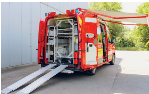
Mehrzweckfahrzeug mit Modul und Auffahrrampe.

Die Anschaffung des Mehrzweckfahrzeuges wird von den zuständigen kantonalen Stellen, der Feuerschutzkommission sowie der Feuerwehr Wagenhausen begrüsst und dringend empfohlen.